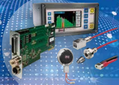
自動磁石バランシステム・ 加工監視AEセンサシステム