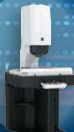
画像式三次元測定機