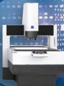
マルチセンサー測定機