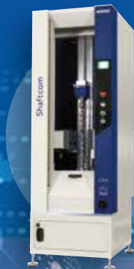
光学式シャフト形状測定機