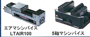
エアマシンバイス LTAIR100 5軸マシンバイス