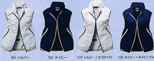
40. シルバー 02. ネイビー 107. シルバー×オフホワイト 105. ネイビー×ネイビーブルー