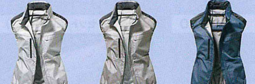
40. シルバー 39. グレー 02. ネイビー