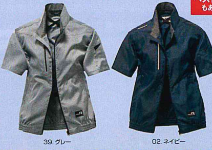
39. グレー 02. ネイビー