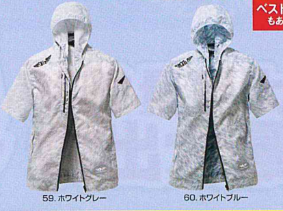
59. ホワイトグレー 60. ホワイトブルー