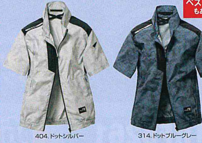
404. ドットシルバー 314. ドットブルーグレー