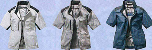
40. シルバー 39. グレー 02. ネイビー