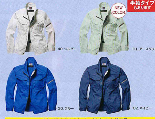
40. シルバー 01. アースグリーン 30. ブルー 02. ネイビー