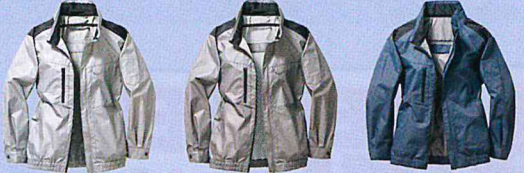
40. シルバー 39. グレー 02. ネイビー