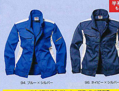
94. ブルー×シルバー 96. ネイビー×シルバー