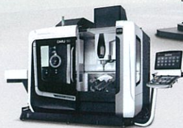
DMU 50 3 rd Generation