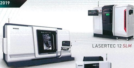
LASERTEC 12 SLM