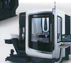
DMU 60 eVo linear