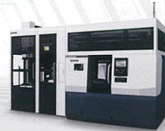
ALX 2000 | 500 with GX