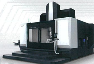
DMU 340 Gantry